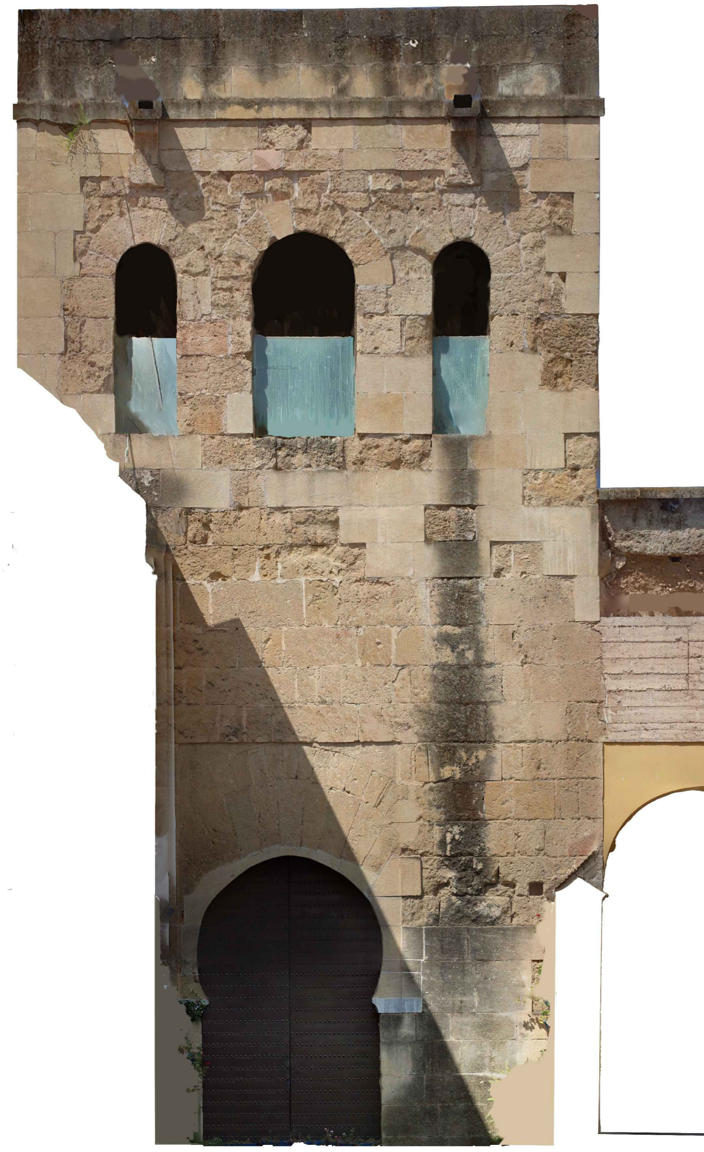
ALZADO PUERTA INTERIOR