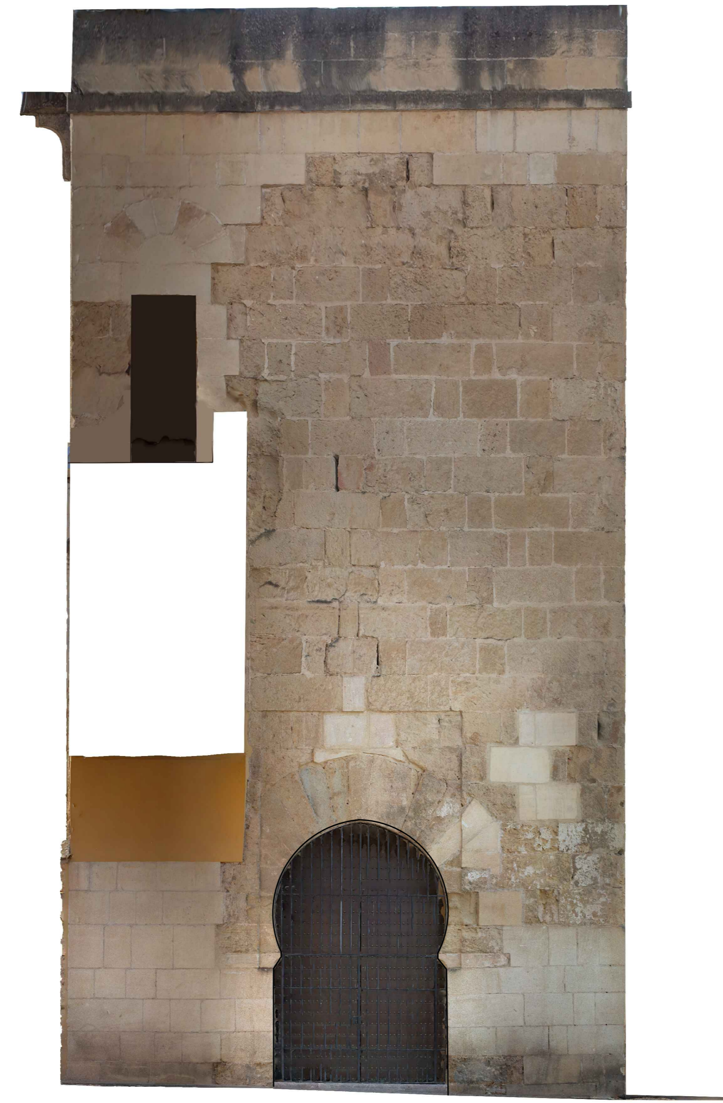
ALZADO PUERTA EXTERIOR