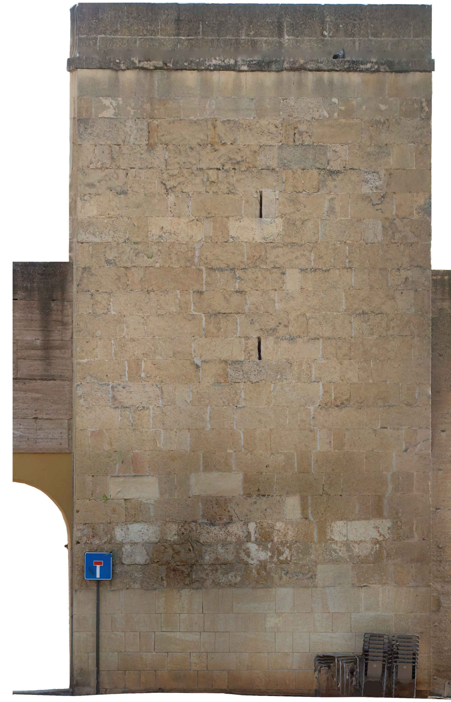
ALZADO FRENTE EXTERIOR