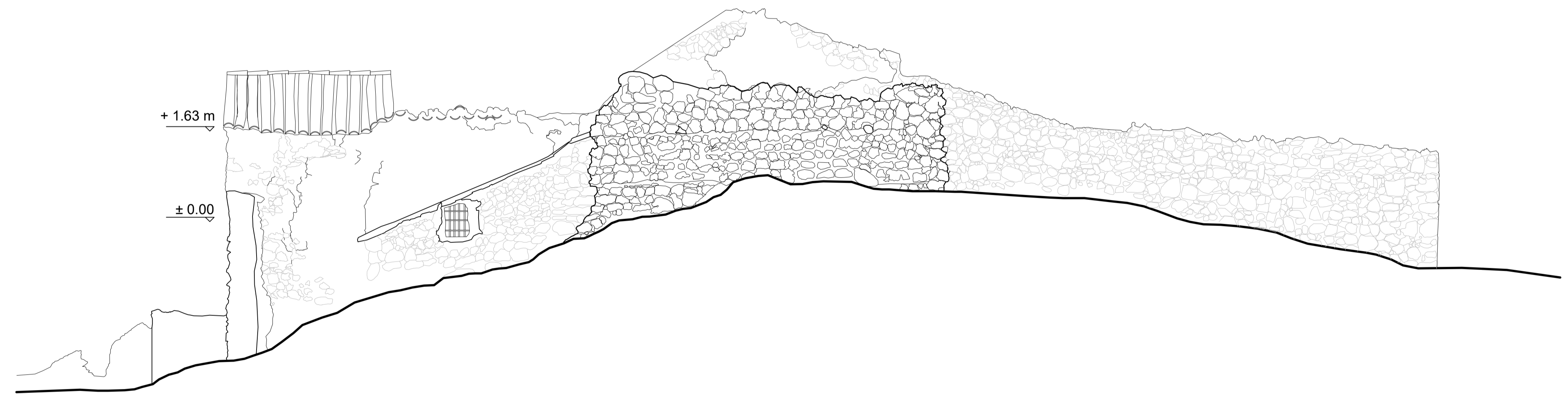
ALZADO SUROESTE (B-B')