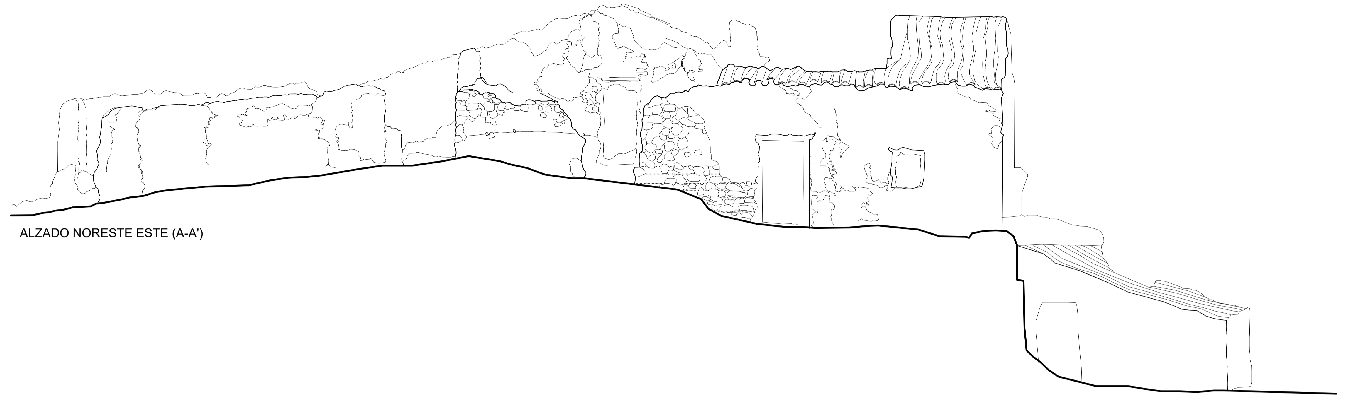
ALZADO NORESTE ESTE (A-A')