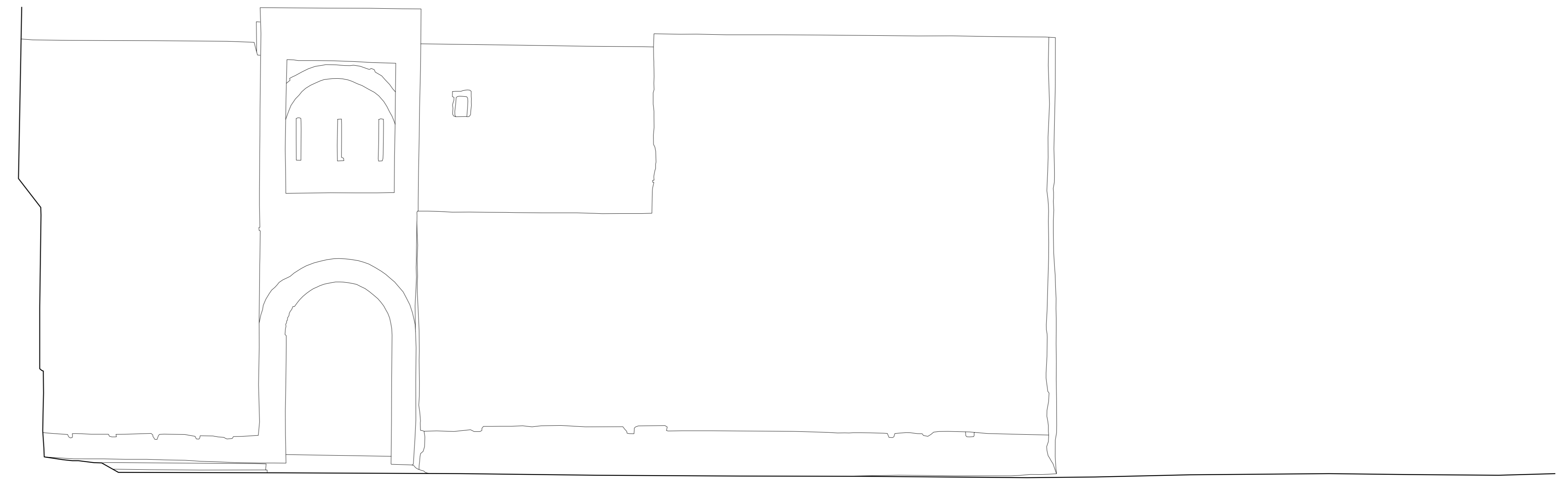
ALZADO EXTERIOR 0 5 10 m JEREZ DE LA FRONTERA (Cádiz) . ALCÁZAR. PUERTA DE LA CIUDAD A. ALMAGRO (ING. ARQUIT.) JULIO 2022