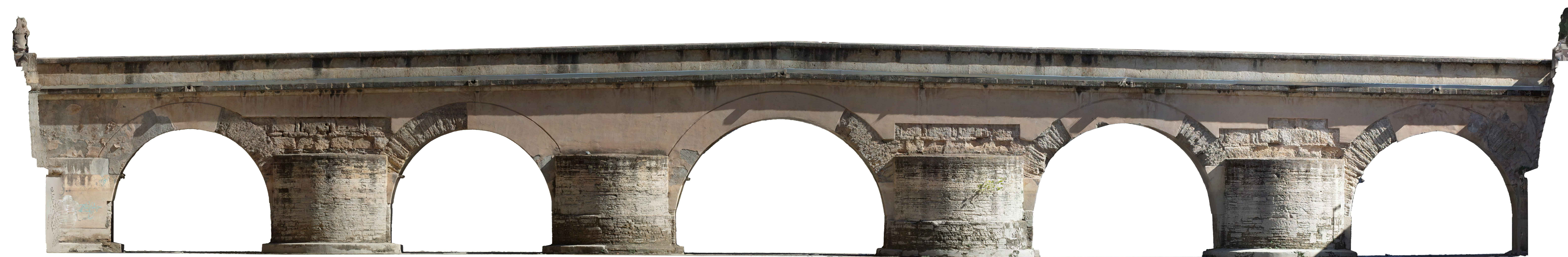
ALZADO AGUAS ABAJO

PUENTE SOBRE EL RIO GENIL. GRANADA A. ALMAGRO / arq. RABASF octubre 2023