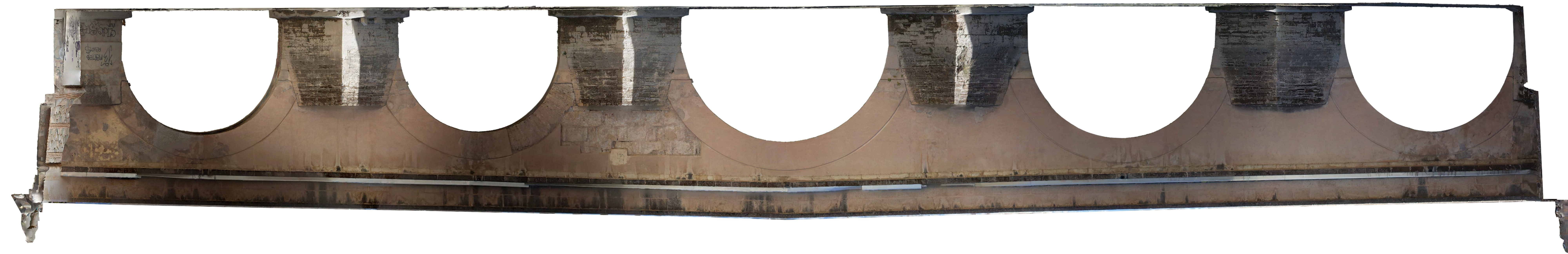
ALZADO AGUAS ARRIBA